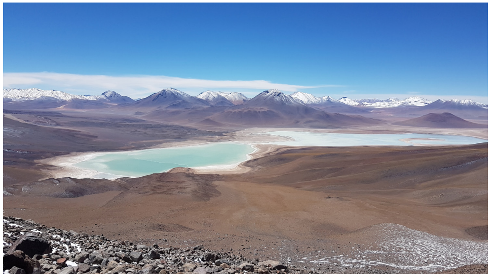
Laguna verde y laguna blanca RNFA Eduardo Abaroa.

El Sistema de Cobros (SISCO) de tarifas de ingreso a áreas protegidas representa la principal fuente de ingreso con la que cuenta actualmente el Sistema Nacional de Áreas Protegidas (SNAP) 1 . Según un estudio realizado por CSF, ajustar las tarifas de ingreso en la Reserva Nacional de Fauna Andina Eduardo Abaroa, y aplicar una tarifa de ingreso al Parque Nacional y Área Natural de Manejo Integrado Cotapata, generaría un total de 4.830.000 USD en un año, lo cual representa un incremento del 52% respecto a las recaudaciones obtenidas por SISCO para 2018.